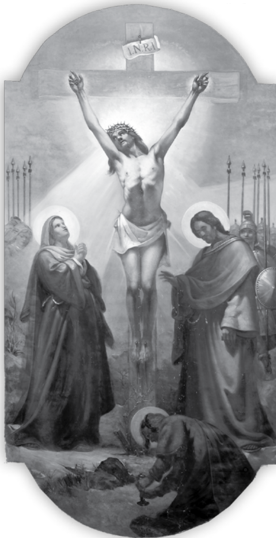
Disinn u Stampar: Veritas Press, Zabbar. Tel: 21 822 270

Fis-7.00p.m. ikollna serata ta' apprezzament tal-pittura u tax-xogħol ta' restawr li sar fuqha.